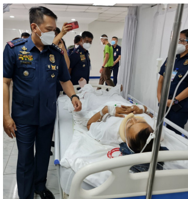
Camp Crame (February 21, 2022) - Kaagad na dinalaw at kinumusta ni Police General Dionardo Carlos ang dalawang (2) survivor ng bumagsak na PNP H125 Airbus na kasalukuyang ginagamot sa PNP General Hospital, Camp Crame nitong hapon ng Pebrero 21, 2022. sundan sa pahina 10