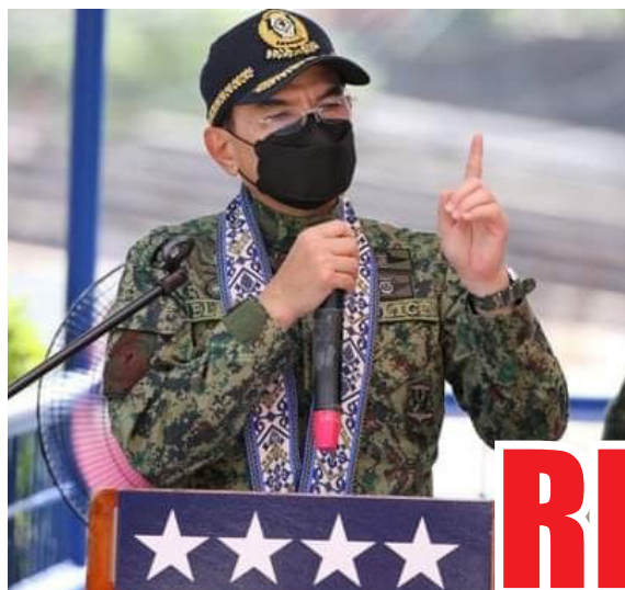
sundan sa pahina 3

3 suspek, huli sa P1-bilyon anti-illegal drug ops sa Cavite sundan sa pahina 11